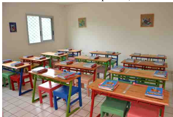
dans une salle de classe

Après la création par le COH d'un centre d'accueil de jour pour enfants autistes, il a été mis en place dans le même lieu une école ordinaire pour aider à l'intégration scolaire des enfants autistes, des formations pour les parents des enfants accueillis, des consultations de dépistage, d'orthophonie au sein d'un cabinet d'orthophonie, etc.