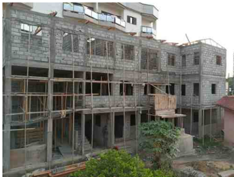
L'ESAT en chantier.

Les travaux ont commencé en 2020 sur un terrain offert par un particulier camerounais et grâce à des dons privés, dont ceux issus de l'action du « Lions Club Douala Paradise », premier club féminin Lions d'Afrique Centrale et partenaire du COH dès l'origine.