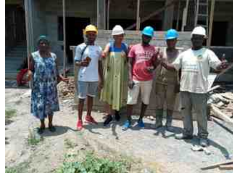
La toiture est enfin terminée.

Au printemps 2021, la maçonnerie et la couverture du bâtiment s'achèvent. Il faut désormais songer à équiper les lieux en mobilier et matériel technique. Il est donc proposé aux membres de l'arapi de participer à une cagnotte pour cet objectif.